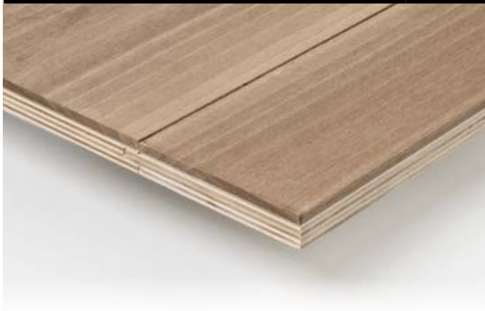
TAVOLA FRASSINO ASH BOARD Spessore | Thickness 15 mm

Spessore | Thickness 15 mm 3 larghezze da/a | Three widths from/to 130/210 mm Lunghezza | Length 1000/2400 mm Spessore nobile | Hardwood thickness 4 mm