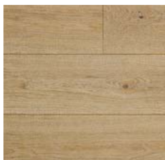
REDORTA Rovere | Oak

Lavorazione | Processing spazzolato, verniciato, decapato brushed, varnished, decapé