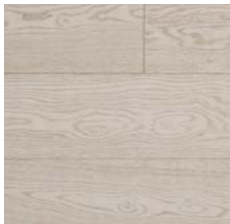
CARSO Rovere | Oak

Spessore | Thickness 15 mm Larghezza | Width 150/190/240 mm Lunghezza | Lenght 1000/2400 mm Spessore nobile | Hardwood thickness 4 mm