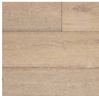
CEPPPO Rovere | Oak

Lavorazione | Processing spazzolato, verniciato, decapato brushed, varnished, decapé