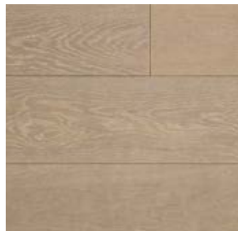
PILASTRO Rovere | Oak

Lavorazione | Processing spazzolato, verniciato, decapato brushed, varnished, decapé