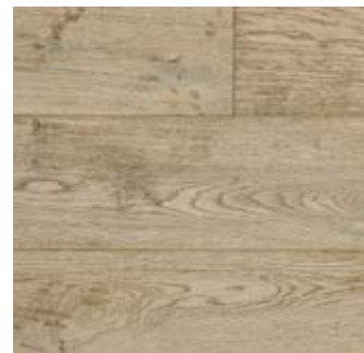
ELVA Rovere | Oak

Lavorazione | Processing spazzolato, verniciato, decapato brushed, varnished, decapé