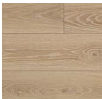
TRICORNO Rovere | Oak

Lavorazione | Processing piillato a mano, spazzolato, verniciato, decapato hand planed, brushed, varnished, decapé