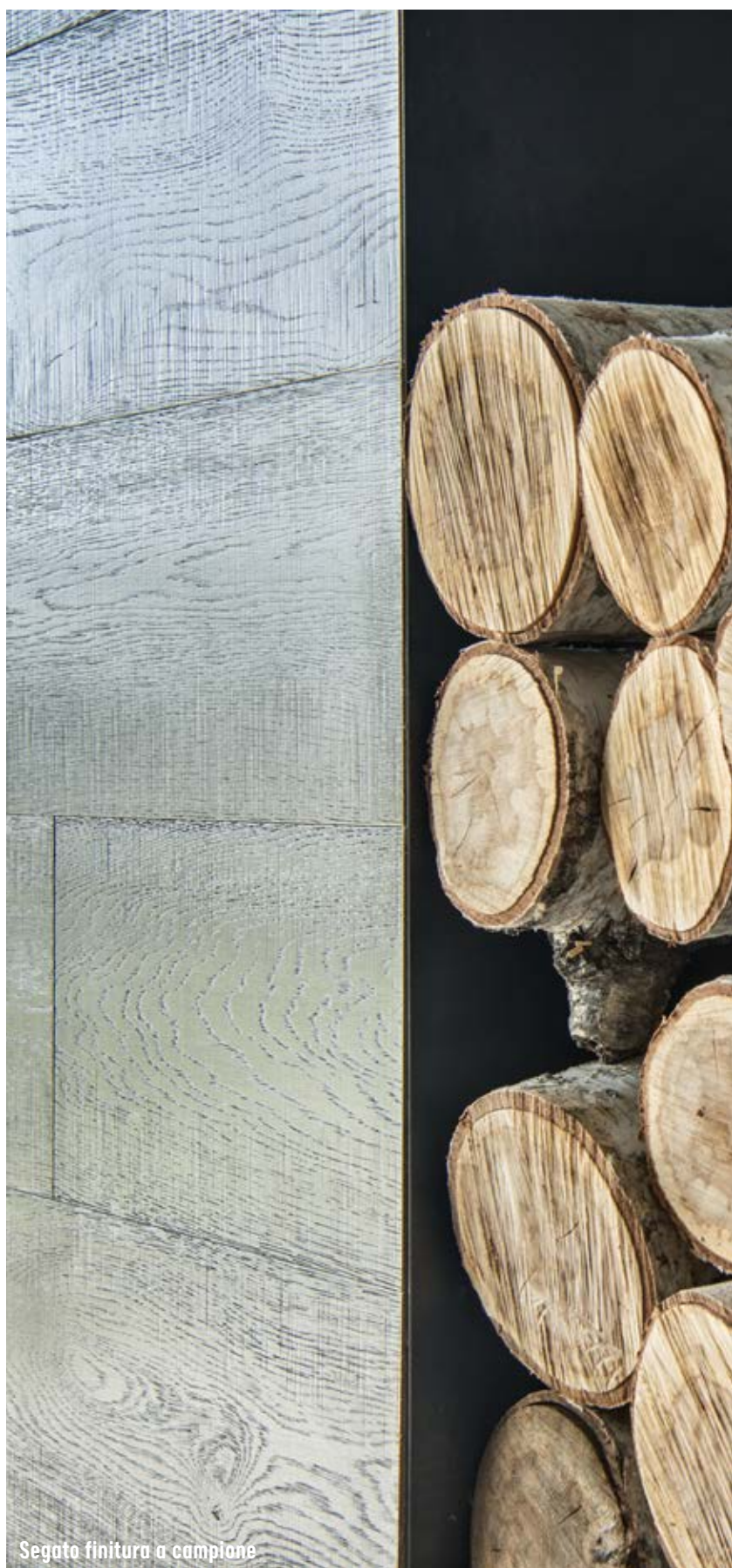
Segato finitura a campione

La linea Dolomiti fornisce una vasta scelta di tonalità scure e definite, particolarmente adatte ad arredamenti classici ed importanti; dai salotti agli studi, queste tavole e listoni accompagneranno e avvolgeranno con stile ed eleganza ogni aspetto della vostra quotidianità.